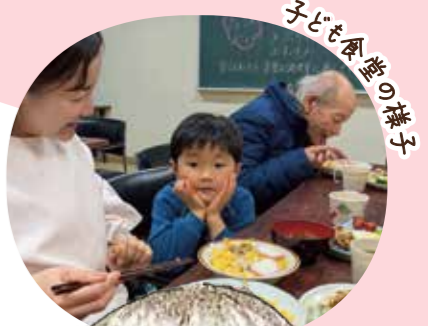
子ども食堂の様子