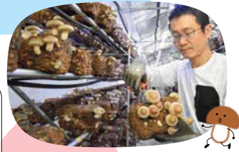
『ハートコープのふぞうい生いたけ』を乾燥させました。

パルシステム神奈川の4つの政策課題(食と農、くらし・福祉、環境、平和)を推進し、社会課題の解決に貢献する商品