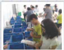
8月に実施したフードドライブ体験学習会の様子

組合員を対象に全11の配送センターで賞味期限が残りながら不要となった食品を寄贈いただくフードドライブを順次実施しています。2019年3月に横浜南センター、麻生センターの一部の組合員を対象に実施したフードドライブでは、対象組合員7,500名に対して、262.89kgの商品提供をいただきました。