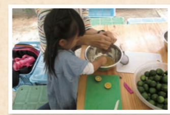
「緑(あお)みかん」ジュースづくりも がんばりました