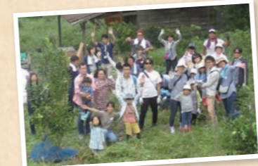
がんばったみなさんで記念撮影