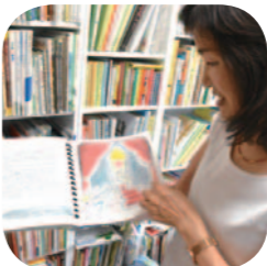
私たちが作った「ユニバーサルデザイン絵本」です!

パルシステムの支援金などで点字プリンターを買いました。これでパソコンで編集し、点字をプラスチックシートに打ち出すことができます。今はさわって絵を感じられる絵本に取り組んでいます。目の見えないお子さんと親がいっしょに読める絵本があることはとてもいいことです。点字だけの本を見ると、自分たちの世界と違うと感じてしまい、親もとてもつらいんです。この本をとおしていっしょの世界にいるんだ、と思っただけであればうれしいですね。