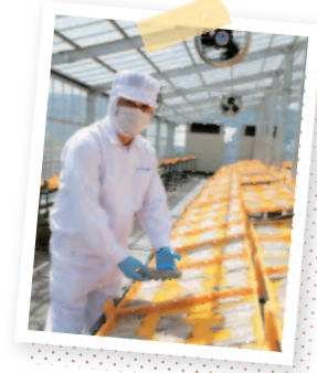
日光と風が魚のうまみを凝縮してくれます