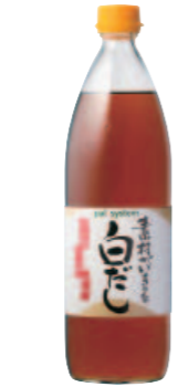
『素材がいきる白だし』 900ml

米2合に大きじ3の「白だし」を合わせ、冷凍のままのお好きな魚の切り身2切れといっしょに炊き込めば完成です！白だしの香りが魚のうまみを引き出します。