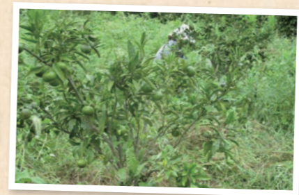
少しずつ生長しているみかんの木

小田原市根府川のみかん畑で8組26名の組合員が草とり作業を行いました。この畑は耕作放棄地のみかん山として再生し、生産者と消費者が交流できる場にしようとしてジョイファーム小田原が中心となり、2016年3月に組合員といっしょにみかんの木を植樹したものです。除草剤を使わない畑はどこから手をつけてよいかわからないぐらい雑草が生い茂っていました。参加者は、みかんの木の生育状況や雑草の種類や特徴などを生産者から聞きながら、木の周辺を重点的に草とりしました。草とりのあとは「緑(あお)みかん」(※)をしばった、みかんジュースづくりで疲れを癒やしました。「貴重な体験ができた」「草とり体験を通じて、生産者の苦勞がわかった」などの感想が寄せられ、産地・生産者への理解を深めることができる企画となりました。 ※ 実の品質をそろえて大きくするため、未熟なまま実を落とす「摘果」したみかんのこと。