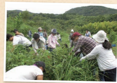
生産者といっしょに草とり