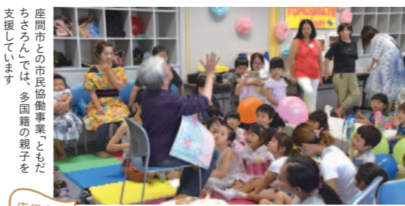
座間市との市民協働事業「ともだちサロン」では、多国籍の親子を支援しています

居場所づくりで子育てを応援 アクティヴママは、座間市で活動する子育て中のママたちによる子育て応援団体。親子が集まる場所づくりや子育て情報の発信をしています。