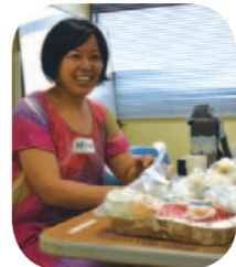
現役バリバリのママたちで活動しています!

支援金は以前使っていた活動拠点の家賃にあてたほか、エアコンや棚の購入に使いました。当時、団体立ち上げ直後だったので支援金はとても助かりました。あの時の支援金があったら、私たちの活動は続いていなかったかもしれません。今は座間市との協働事業の多国籍親子支援事業や子育てサロン、子ども食堂も行っており、7月から社会福祉協議会と学習支援を行っています。大きなことができなくても、助けを必要とする人に寄り添った活動を続けていきたいです。