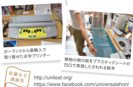
ポランドから直輸入で取り寄せた点字プリンター

点字シートでいっしょに読める UniLeafは、一度絵本を解体し、点字を刻印したプラスチックシートを入れて再製本した、目の見えるお子さんも見えないお子さんいっしょに楽しめる「ユニバーサルデザイン絵本」を作る活動をしています。