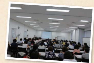
多くの組合員にご参加いただきました