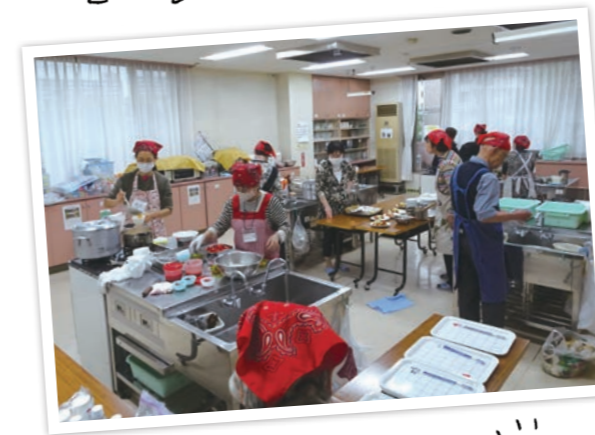
「サンタの家」子ども食堂準備中 (2016・2017年度 支援団体)

神奈川県内など身近な地域で活躍する市民団体とネットワークを築き、くらしやすい地域をつくるため、当組合が資金面で応援する制度です。これまでのべ371団体に7,403万円を支援しました。支援金の使い道の一例として、子どもの居場所づくりを行う団体では、子ども食堂の食材費、農業体験の種や園芸資材、冷蔵庫の購入に使われました。単なる資金援助だけでなく、支援団体・組合員・役員・中間支援団体など、さまざまな方