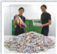
みなさんのご協力ありがとうございました

CO・OP共済「助け合いの心を折り鶴に込めて」 8月12日~16日の間、組合員のみなさんに「CO・OP共済「助け合いの心を折り鶴に込めて」のチラシを配付し、折り鶴作成にご協力をお願いしました。これまで当組合に集まった折り鶴は、約10万羽となっています。