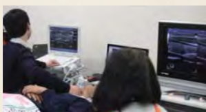
医師、技師にご協力いただいています