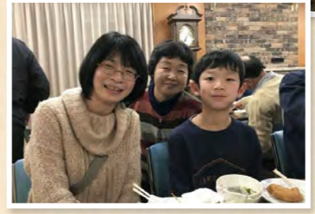
夕食交流会で女性生産者と

JAみどりの(宮城県)へ訪れるのは3回目です。春や夏は家族全員で行きましたが、小学5年の息子が学校で稲の学習をし、冬の産地の様子に興味があったため、ふたりで出かけました。