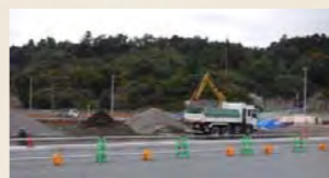
昨年まで放置されていた津波被害を受けた家屋も、整備がすすみ少なくなりました