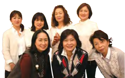
組合員が開発に協力しました