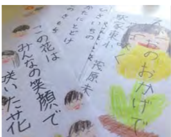
故郷を離れて生活する子どもも多い

たとえばベラールンでは、チェルノブイリの事故から30年がたった現在でも、住宅支援や、