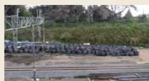
放射線廃棄物が詰まったフレコンバッグ