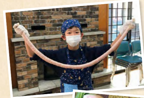
手作りフランクフルトに挑戦