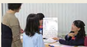
組合員ボランティアも運営に参加しています