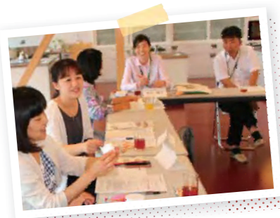
試作品評価と意見交換を繰り返しました

根岸 プラセンタエキスとともにセラミド、コラーゲン、ヒアルロン酸などの保湿成分を加えました。またリラックス効果を高める香りには柑橘やティーツリー、ユーカリなどハーブの天然精油を使用しています。反対にパラベンや鉱物油、合成着色料は不使用。組合員のみ