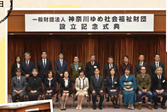
一般財団法人 神奈川ゆめ社会福祉財団 設立記念式典