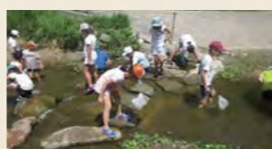
横須賀の関根川で川遊び&生きもの観察