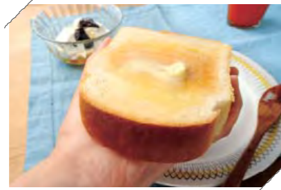
原料は小麦粉、ホシノ天然酵母パン種、『花見糖』、『海はいのち(長崎県産海水塩)』のみ