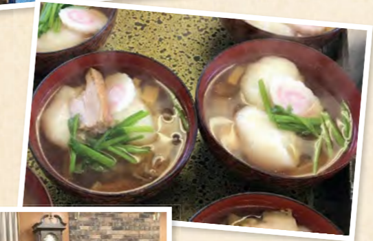
つきたてのおもちが入った小正月のお雑煮