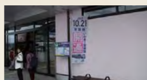
運行が復旧したJR高岡駅にて