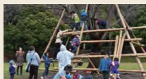
みんなで作った竹のジャングルジム

ども(親子)を神奈川県に招き、自由に戸外で遊べる機会を提供しています。少しでも子どもたちや保護者の心身のリフレッシュになればと願い、2013年より、取り組みを続けています。