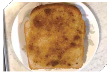
バターと「使えるカレー」で、ほんのりスパイシーなパンに。ハムや卵をのせてもおいしいです。