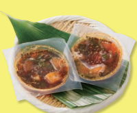
3種の海鮮丼 (まぐろ、めかぶ、紅鮭いくら) 100g(50g×2)