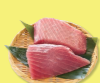
きはだまぐろ 腹身ステーキ用 2切180g