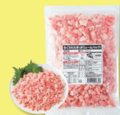
まぐろたたき ボリュームパック 320g