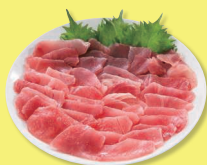
まぐろ切り落とし ボリュームパック 260g