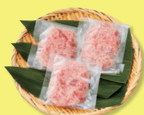
生からつった まぐろたたき 40g×3