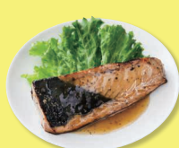
炙りかつお (黒胡椒オリーブオイル) 170g(かつお140gたれ30g)