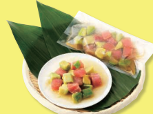
まぐろアボカドボキ丼 70g×2