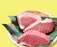
きはだまぐろ 腹身ステーキ用 3切270g