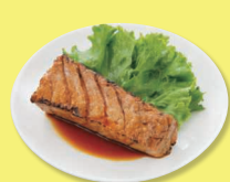
ロースたまぐろ 120g+タレ30g