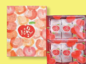
りんごかめめ 玉子(ミニ) 6個