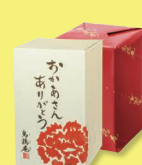
烏骨鶏かすていら (おかあさんありがとう) 1本