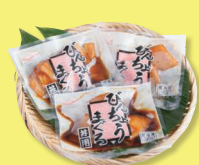
まぐろ屋さんの びんちょうまぐろ丼 60g×3