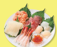
手巻き・海鮮丼セット 6種185g