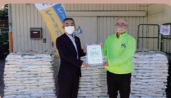
「フードバンクかながわ」へ食品を寄付

食支援のネットワーク 諸団体と「フードバンクかながわ」を設立し、生活困窮者支援と食品ロス削減を実施