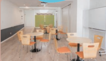
ふらっとパル茅ヶ崎