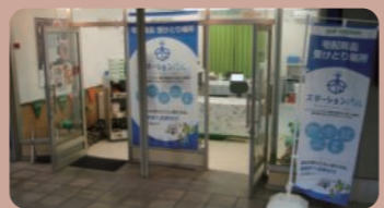
藤沢市善行のステーションパル

ステーションパル 通常の配達以外に商品を受け取れるサービス。買い物支援からコミュニティづくりへ